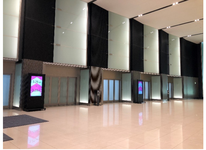
1階エントランスロビー