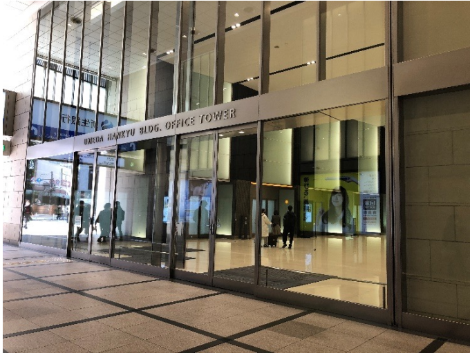
大阪梅田ツインタワーズ入口